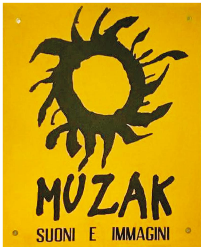
Fig. 2 Insegna del negozio di dischi Muzak, oggi sala prove a Casalpusterlengo, dedicata a Galuzzi.

«Con la chiave inglese batto sulla lamiera ritmi strani»: musica, lavoro e poesia operaia