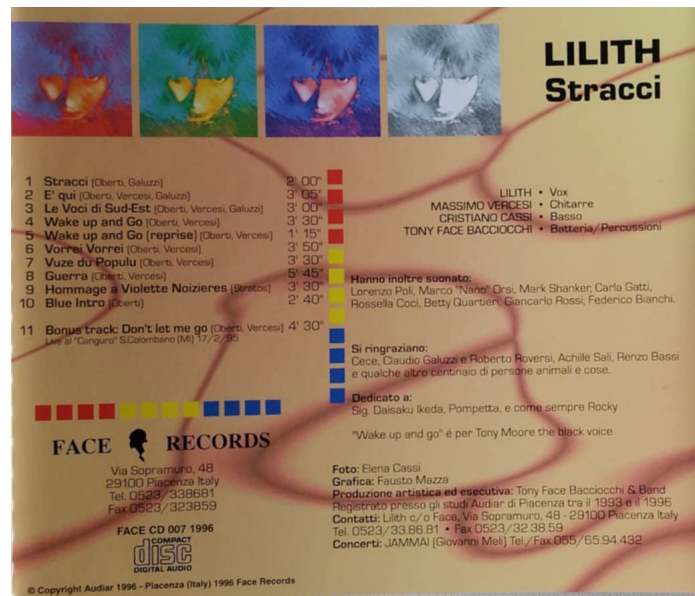
Fig.1 Retrocopertina di Stracci , 1996

Negli stessi anni, Galuzzi gestisce il negozio di dischi Muzak (Fig. 2), nome che richiama volutamente la “musica da ascensore” o easy listening : un sottofondo che non sovrasta, un tappeto musicale uniforme e discreto in contrasto con i rumori continui della fabbrica evocati da Francesco Currà e da Tommaso Di Ciaula. Nel 2021, Gregory Fusaro gli dedica il docufilm Se il cielo è tradito — dal titolo di un suo verso — che raccoglie alcune testimonianze di amici e artisti come Cristina Donà, Antonio Baccocchi, Manuel Agnelli, Ermanno Pea: