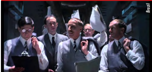
TAP Castille 5,5 € la séance / Le Joker 3 €