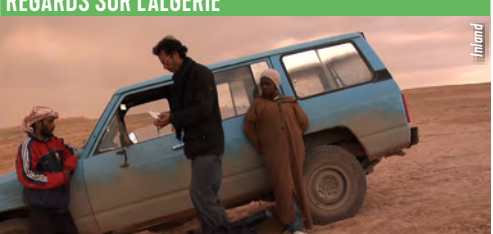
TAP Castille 5,5 € la séance / Le Joker 3 €