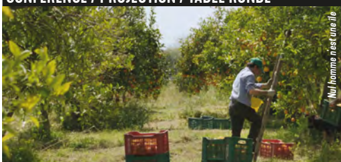
Hôtel Fumé - Amphi Descartes Entrée libre