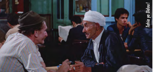
Tahia ya Didou!

TAP Castille 5,5 € la séance / Le Joker 3 €